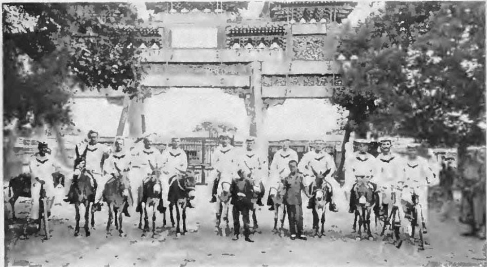
Mitte: Abgelöste Mannschaft mit Heimatwimpel. Oben: S. M. S. Ritis. — Unten: Am Tor des Lama-Tempels in Peking.