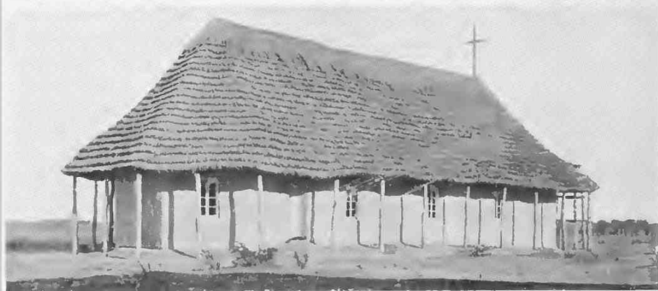
Mitte: Inneres der katholischen Kirche Kribi. Oben: Inneres alter Missionskirche. — Unten: Alte Missionskirche in Südwestafrika.