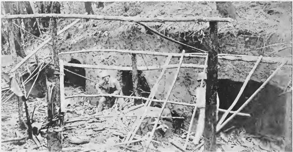
Mitte: Detachement „Guden“ im Lager. Oben: Gipfel des Dschotatsch nach der Erstürmung. Unten: Ueberstände am Dschotatsch.