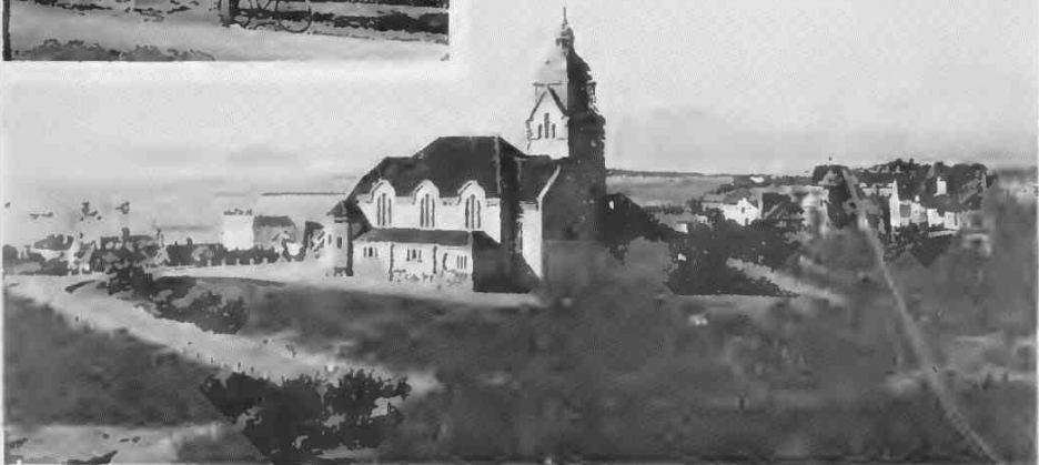
Mitte: Evangelische Kirche, Tar-es-Zalän. Oben: Katholische Kirche, Vome — Unten: Christuskirche, Tjingtau.