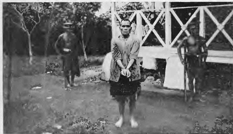
Mitte: Marinetruppen im Lager (Vonape). Oben: Gefangene Aufständische Vonape. Unten: Häufelsführer der Aufständischen (Vonape).