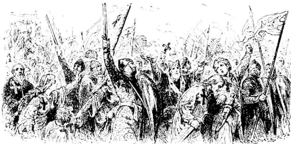
Gott will es!

3. Kirchenversammlung in Clermont. 1095 berief der Papst eine Kirchenversammlung nach Clermont. Hier auf freiem Felde schilderte er, wie der Tempel in eine Moschee verwandelt, die Bilder des Heilandes an Nase und Ohr, an Arm und Bein verstümmelt und die Christen gemartert und geschändet worden seien. Wer an dem Kampfe gegen die Ungläubigen teilnehmen würde, dem wurde Vergebung der Sünden und ewiger Lohn im Himmel zugesichert. „Gott will es,