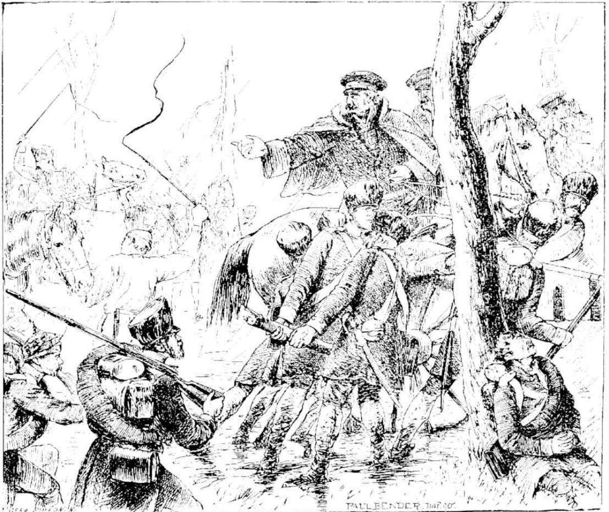
Blücher in der Schlacht bei Belle-Alliance.

13. Belle-Alliance. (18. Juni.) Jetzt wandte sich Napoleon gegen die Engländer. Wellington hatte bei Waterloo, Napoleon hinter dem Meierhose Belle-Alliance Stellung genommen. Sogleich schickte Wellington zu Blücher und ließ ihn bitten, ihm