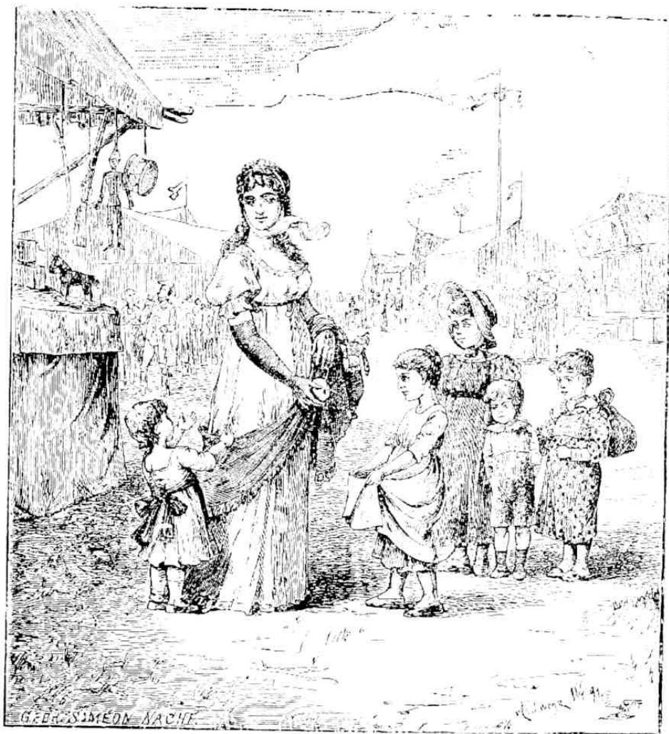
Königin Luise und die Dorfkinder.

1. Als Kronprinz. Luise. Der Kronprinz Friedrich Wilhelm nahm 1792 auch an dem Feldzuge teil, den sein Vater damals gegen Frankreich unternahm. Auf diesem Feldzuge sah er in Darmstadt zum erstenmal seine spätere Gemahlin, die Prinzessin Luise von Mecklenburg-Strelitz. Ein Jahr darauf vermählte er sich mit ihr. Das junge Paar führte ein so einfaches häusliches Leben, wie es damals nicht einmal bei reichen Kaufleuten, noch viel weniger am Hofe üblich war. Am liebsten verweilte das junge Paar in Pareß, einem Dorfe bei Potsdam. Dort hatte Fr. W. ein sehr einfaches Landhaus bauen lassen. „Nur immer bedenken“, hatte er dem Baumeister oft gesagt, „daß Sie für einen armen Gutbesitzer bauen!“ In dem Landhause sah man keine kostbaren Möbel und Teppiche, keine seidenden Decken und Vorhänge, weder Gold- noch Silbergerät. Alles war sehr einfach. Luise hieß hier die „gnädige Frau von Pareß“. Am Erntefeste der Bauern mischte sich das fürstliche Paar sogar unter die Tänzer. Gewöhnlich ging dann auch die Königin in die Buden und kaufte für die Kinder des Dorfes allerlei Süßigkeiten ein. Dabei drängten sich die Kleinen oft dicht an sie heran und riefen: „Wir auch was, Frau Königin!“