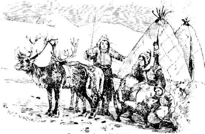
Lappe im Schlitten.

Die Halbinsel ist größtenteils mit Gebirgen, Seen und Wäldern angefüllt, und nur \frac{1}{10} des Landes eignet sich zum Ackerbau. Daher erklärt sich die geringe Bevölkerung des Landes. Auf 1 qkm kommen hier durchschnittlich nur 9 Menschen. (In Belgien 215, im Königreich Sachsen 252!) Den Süden und Osten bewohnen Schweden, den Westen Norweger, den hohen Norden Lapp-