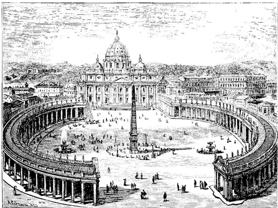
Peterskirche in Rom.

6. Rom war ehemals die erste Stadt der Welt. Sie zeichnet sich durch viele Sehenswürdigkeiten aus. Da ist zunächst der mit einer vierfachen Säulenreihe geschmückte Petersplatz. Auf ihm stand ehemals der Circus des Kaisers Nero, worin Christen mit wilden Tieren kämpfen mußten. Am westlichen Ende dieses Platzes erhebt sich die prachtvolle Peterskirche, die größte Kirche der Welt. Sie enthält 29 Altäre und faßt 54000 Menschen. In einer Kapelle unterhalb der Kirche werden in einer Nische des Altars die Gebeine des Apostels Petrus aufbewahrt. Neben der Peterskirche steht der Wohnsitz des Papstes, der Vatikan. Er setzt sich aus vielen Palästen, Höfen und Gärten zusammen, zählt 11000