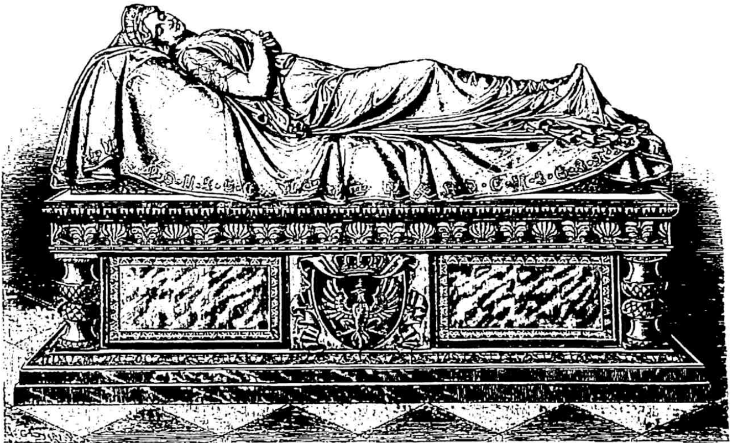
Grabdenkmal der Königin Luise im Mausoleum zu Charlottenburg.

Auch die von Stein begonnenen Reformen wurden nicht unterbrochen. Die Berufung Hardenbergs hatte die Königin Luise noch erlebt und als neuen Hoffnungsstrahl begrüßt; war er doch am besten geeignet, Steins Werk fortzusetzen. Freiherr von Hardenberg war wie Scharnhorst Hannoveraner, hatte in hannoverschen und braunschweigischen Staatsdiensten gestanden, war dann nach Ausbach-Baireuth gegangen und hatte die Übernahme dieses Landes