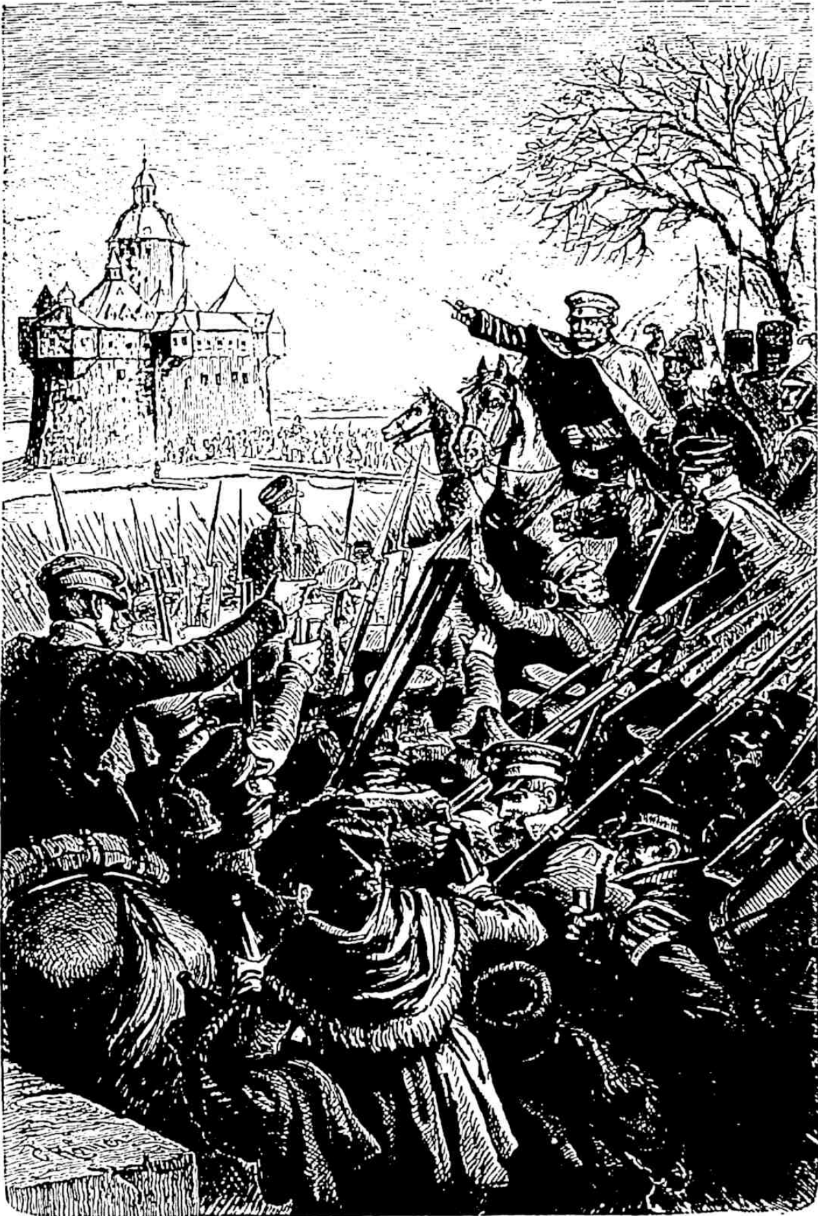
Der Marschall Borwärtz überschreitet den Rhein am 1. Januar 1814.