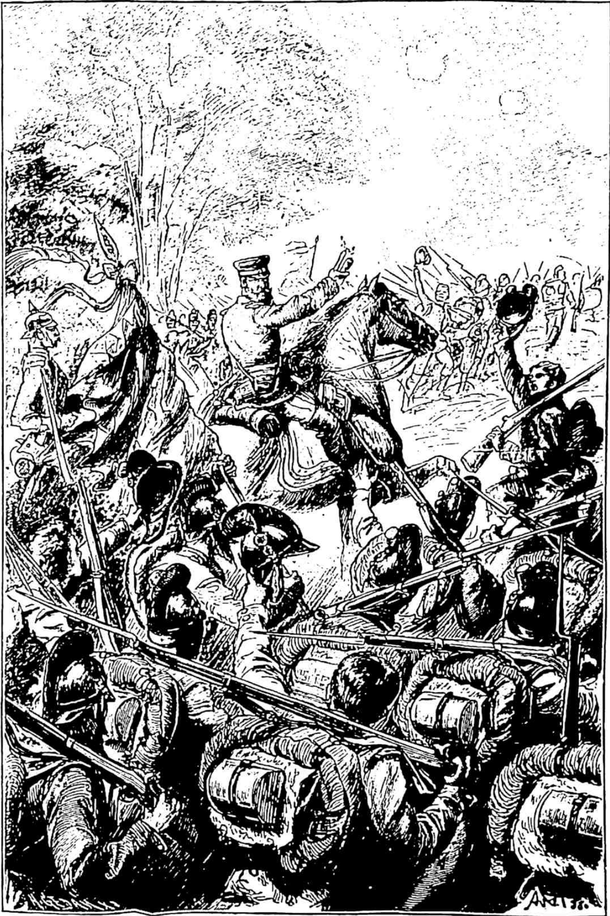
Der Kronprinz führt die Bayern zum Siege bei Weissenburg.