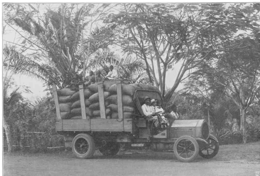
Laftauto in Togo (Straße Jo-Kpandou).