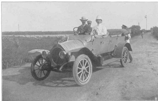
Perſonenauto in Togo.