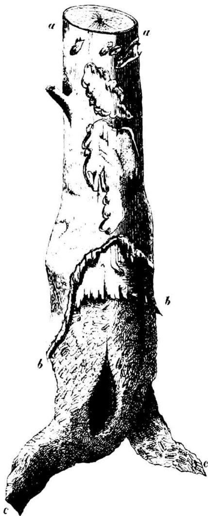
Figur 131. Hasenfraß (ab) und Mäusefraß (bc) an demselben Stamm.

man über dem Wurzelknoten mit einem glatten schrägen Schnitt möglichst tief ab, damit der Stock wieder frisch ausschlagen kann. Sollte der Fraß unterhalb des Wurzelknotens stattgefunden haben, so giebt es keine Rettung. Das Zurückschneiden soll man jedoch nur anwenden, wenn größere (mehr als 5—6 Quadratmeter) Lücken zu befürchten sind. Alle Verstecke der Mäuse — Wachholderbüsche, Laubanhäufungen, Brombeerhecken, dichte Ausschläge zc. — müssen entfernt werden. Als Vertilgungsmaßregeln sind Fanggräben und in diesen Fanglöcher, beide mit ganz glatten senkrechten Wänden oder eingesenkten und mit etwas Wasser gefüllten Töpfen oder Vergiftung durch arsenik-, strychnin- oder phosphorhaltigen Weizen oder Hafer, der in enge Drainröhren gelegt wird, sehr zu empfehlen und Schweineeintrieb, falls dieser sonst zulässig ist. Man lege auch z. B. in Buchenverjüngungen viele kleine Reisighaufen auf Stangen und unter diese die Drainröhren mit strychninvergiftetem Hafer. Die Mäuse sammeln sich massenhaft unter diesen Schutthaufen und vergiften sich; die todtten wurden sogar von den lebenden gefressen und ein durchschlagender Erfolg erzielt. Vergl. Zeitung für Forst- und Jagdw. 1887, S. 38. Wenn auf benachbarten Feldern sich viele Mäuse