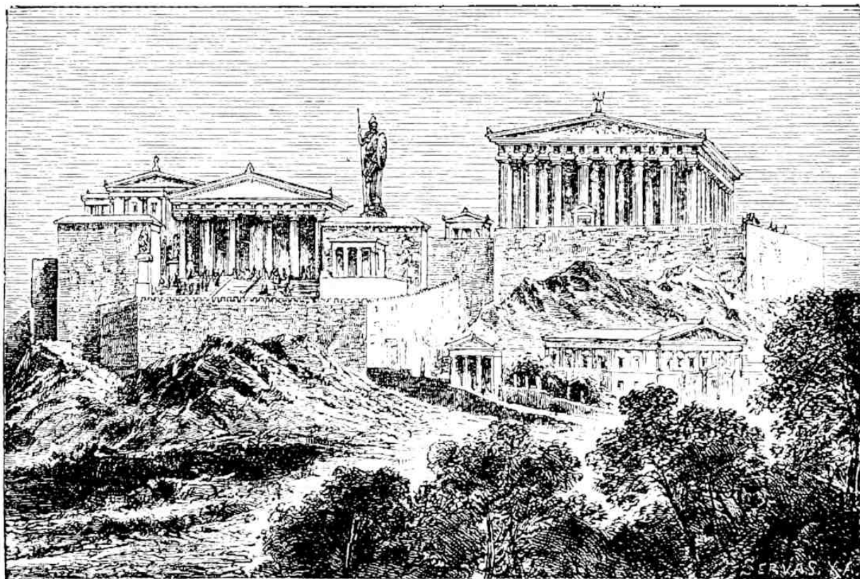
4. Die Akropolis in Athen zur Zeit des Perikles.

deines Mantels schaut die Eitelkeit!" sagte er zu einem seiner Schüler. Einem schönen Jünglinge, welcher schmutzige Reden führte, rief er zu: „Schäme dich, aus elfenbeinerner Scheide eine bleierne Klinge zu ziehen!" Als ihn das Orakel zu Delphi für den weisesten Mann erklärte, meinte er demütig: „Meine Weisheit besteht in der Erkenntnis, daß ich nichts weiß!" Seine Feinde klagten ihn an, daß er die Götter verachte und die Jugend verführe. Er wurde zum Tode durch den Schierlingsbecher verurteilt. Heiter unterwies er noch 30 Tage seine Schüler im Gefängnis. „Ach, daß du unschuldig sterben mußt!" klagte einer. „Wolltest du lieber, daß ich schuldig sei?" antwortete der Weise. Ruhig trank er das Gift, ging umher, bis die Füße schwer wurden, und starb mit den Worten: „Vergiß nicht, o Kritias, dem Asklepios (dem Gott der Heilkunde) einen Hahn zu opfern; wir sind ihm einen schuldig!" So starb der beste aller Griechen.