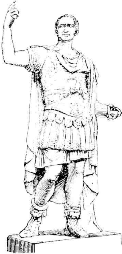
8. Julius Cäsar.

1. Julius Cäsar wurde 100 v. Chr. aus edlem Geschlechte in Rom geboren. Seine ungewöhnlichen Anlagen erregten Bewunderung und wurden von seiner trefflichen Mutter sorgfältig entwickelt. Von dem Diktator Sulla ließ er sich lieber ächten als von seinem Weibe trennen. Als er auf die Bitten seiner Freunde von dem Diktator begnadigt wurde, sagte dieser: „So nehmt denn hin euren Cäsar, doch wisset, daß in ihm mehr als ein Marius (des Diktators größter Feind!) steckt!“ In Rom gewann Cäsar durch seine Beredsamkeit, Freigebigkeit und Freundlichkeit alle Herzen. Freilich stürzte er sich auch in ungeheure Schulden, aber von Amt zu Amt trug ihn die Volksgunst. Da er als Statthalter nach Spanien ging, übernachtete er in einem elenden Städtlein und sprach das Wort: „Lieber wollte ich hier der erste als in Rom der zweite sein!“ Mit Ruhm und Gold kehrte er aus Spanien nach Rom zurück und verband sich hier mit dem reichen Crassus und dem ruhmgekrönten Pompejus zum ersten Triumvirate oder Dreimännerbunde. Als Statthalter ging er nach Gallien, eroberte