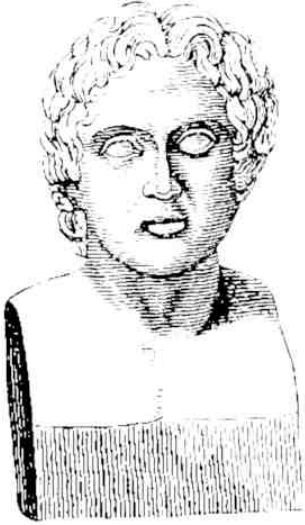
6. Alexander der Große.

1. Alexander war der Sohn des Königs Philipp von Macedonien. Sein trefflicher Lehrer war der Weltweise Aristoteles . Dankbar sagte Alexander: „Meinem Vater verdanke ich nur mein Leben, meinem Lehrer aber, daß ich würdig lebe.“ Als Jüngling zähmte er das wilde Streitroß Bucephalus so geschickt, daß sein Vater ausrief: „Mein Sohn, suche dir ein anderes Reich, Macedonien ist für dich zu klein!“ Bei den Eroberungen seines Vaters rief Alexander aus: „Mein Vater wird mir nichts mehr zu erobern übrig lassen!“