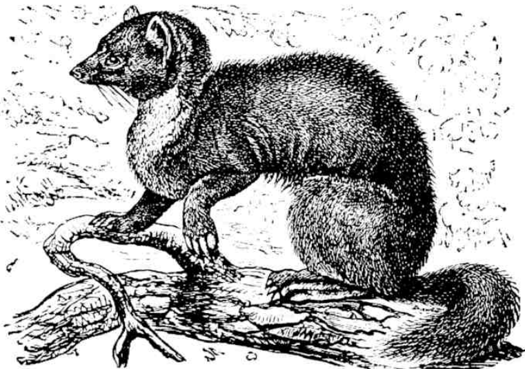
2. Edelmarder ( \frac{1}{10} nat. Größe).

1. Der Marder ist der Schrecken der brütenden Baumvögel, ein blutgieriger Räuber, an dem nichts edel ist als der Pelz. — 2. Er ist länger und schmiegsamer als eine Katze, hat noch kürzere Beine als diese, tritt mit den Zehen auf, kann aber die Krallen nicht einziehen. Sein köstlicher brauner Pelz besteht aus feinen, dichten Woll- und längeren Grannenhaaren. Brust und Kehle