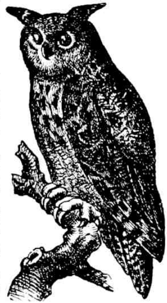
66. Uhu ( \frac{1}{10} nat. Gr.).

1. Diese beiden Vögel gehören zu den Raubvögeln; der erste ist ein Tag-, der Uhu ein Nachtraubvogel. Der Kondor ist der größte Geier, der Uhu die größte Eule. — 2. Der Kondor wird so groß wie ein Kalb, der Uhu wie eine Gans. Der Kondor ist blauschwarz mit weißem Halskrausen, der Uhu rostgelb und schwarz geflammt. Der K. hat an dem nackten Kopfe einen Fleischkamm, an dem