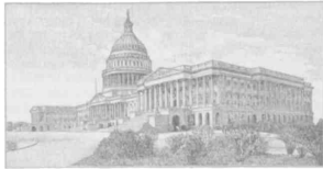
Kapitol zu Washington.

8. Erzeugnisse und Städte. a) Unter allen Ländern der Erde liefern die Vereinigten Staaten das meiste Getreide; besonders in der Mississippi-Ebene. Hier erntet man ungeheure Mengen von Mais und Weizen. Wir beziehen von hier jährlich für über 100 Millionen Mark Weizen. Auch die Rindviehzucht wird hier in großem Umfange betrieben. Der Mittelpunkt des großartigen Korn-, Vieh- und Fleischhandels ist Chicago (2,2 M. E.).