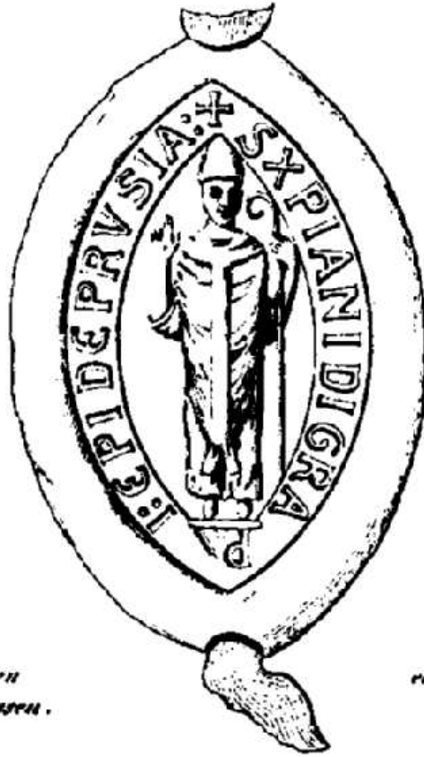
Siegel Christian's ersten Bischofs von Preussen.